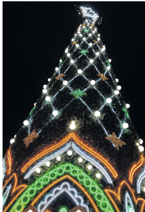
IRKUTSKIN JOULUKUUSI kaikessa komeudessaan.