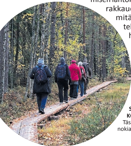
SEURAKUNNASSA KOHDATAAN ihmisiä. Tässä ollaan kävelylenkillä nokialaisen luonnon keskellä.