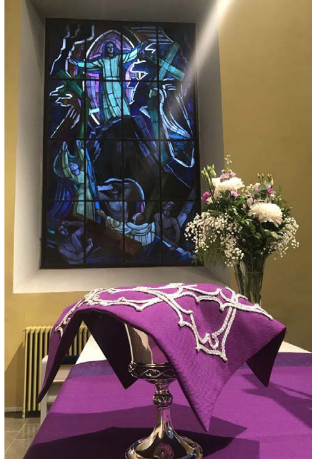
NOKIAN KIRKON lisäksi korona-ajan ehtoollisia on vietetty myös kyläkirkoissa.