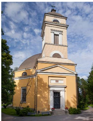
Pääsiäisen jumalanpalvelukset ja ehtoolliset s. 7