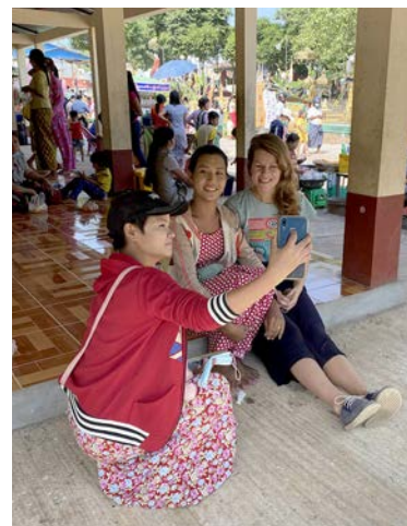
Kuulumiset vallankumouksen keskeltä s. 10–11