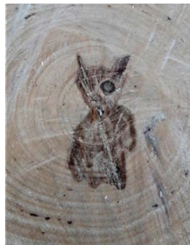
Hautausmaalla kaadetun puun sisästä löydetty hahmo s. 8–9